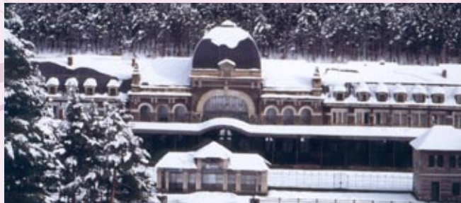
■ Estación de Canfranc.

Gran parte del camino hacia Candanchú y Astún, coincide con el trazado del Camino de Santiago, la primera gran ruta europea, trazada por la devoción hace más de mil años por la que transitaban millones de peregrinos.