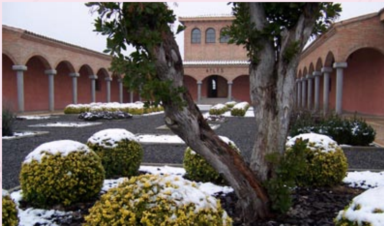
■ Bodega Aylés.

“Pago de Aylés” será el primer y único vino de Aragón que pueda llevar la calificación de más calidad que se puede dar a un vino en la Unión Europea: “Vino de Pago”. Solamente diez bodegas en España podrán etiquetar sus vinos con esta palabra. Por encima de las calificaciones con denominación de origen, un vino de pago, vino del terruño, supone llegar al más alto escalafón del vino de calidad, semejante a los “chateau” franceses.